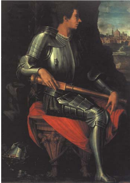
Alessandro de' Medici, Herzog von Florenz, 1511 – 1537 (Vasari)