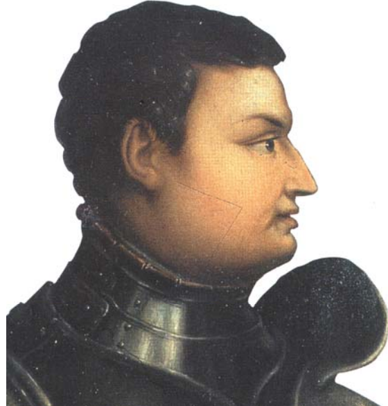
Giovanni delle Bande Nere, 1498 - 1526 (Werkstatt von Bronzino)