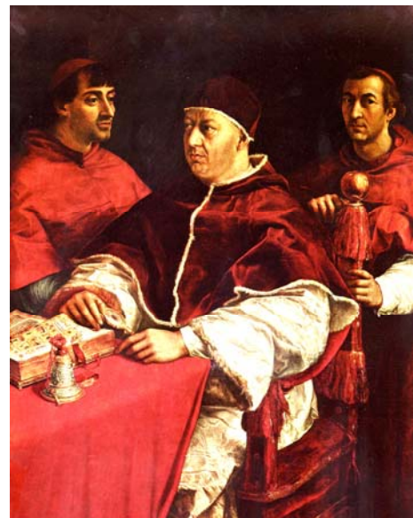
Papst Leo X., 1476 – 1521 (Papst ab 1513), mit den Kardinälen Luigi Rosso und Giulio de' Medici, 1478 – 1534 (ab 1523 Papst Clemens VII.) (Raffael)