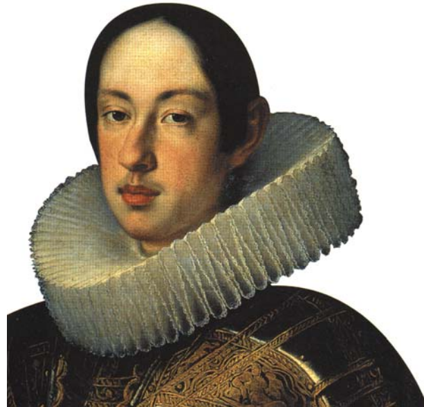
Fernando II. de' Medici, 1610 – 1670 (Sustermans)

die Großmutter Ferdinandos, Christina von Lothringen, und die Mutter Ferdinandos, Maria Magdalena von Habsburg.