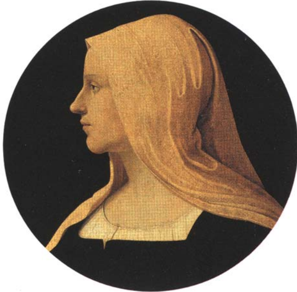
Caterina Sforza, 1462 – 1509 (Palmezzano)