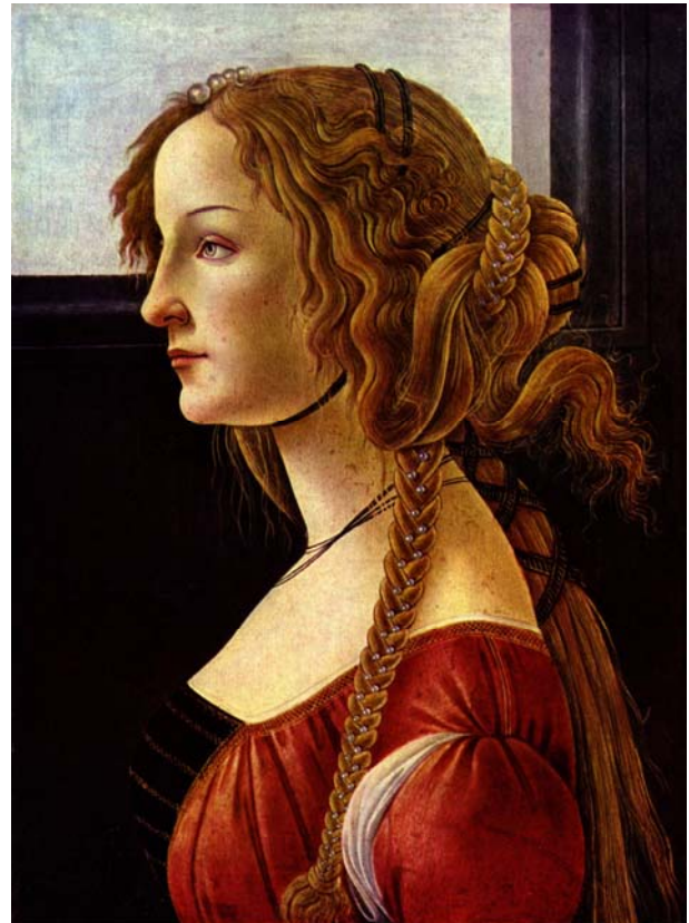
Simonetta Vespucci, die mit 18 Jahren verstorbene Dame von Giuliano de' Medici (Botticelli)

Der Bruder Giuliano, 4 Jahre jünger als Lorenzo, ist ein ausgesprochener Beau, intelligent, der Liebling der Florentiner. 1475 kämpft dieser ebenfalls ein spektakuläres Turnier unter Anteilnahme von ganz Florenz unter dem Motto „ La sans par “ (die Ohnegleiche). Die Ohnegleiche ist Simonetta Vespucci, verheiratet. Simonetta stirbt bald an Schwindsucht, kurze Zeit vor Giulianos Ermordung bei der Pazzi-Verschwörung.