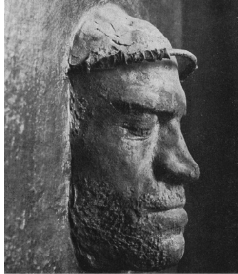
Lorenzo il Magnifico (der Prächtige), 1449 - 1492 (Totenmaske)

Als sein Vater stirbt, ist Lorenzo 20 Jahre alt. Seine engste Beraterin ist die Mutter, Lucrezia Tornabuoni.