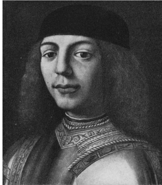
Piero lo Sfortunato (der Unglückliche), 1471 - 1503 (Bronzino)

1494 marschiert der französische König Karl VIII. mit 30 000 Soldaten in Italien ein, um sich das Königreich Neapel einzuverleiben. Karl verheert und plündert Italien. Damit beginnt der politische und wirtschaftliche Niedergang Italiens, die zunehmende Bestimmung der Geschieke des Landes durch die Fremdmächte, die Barbaren, wie die Italiener sagen.