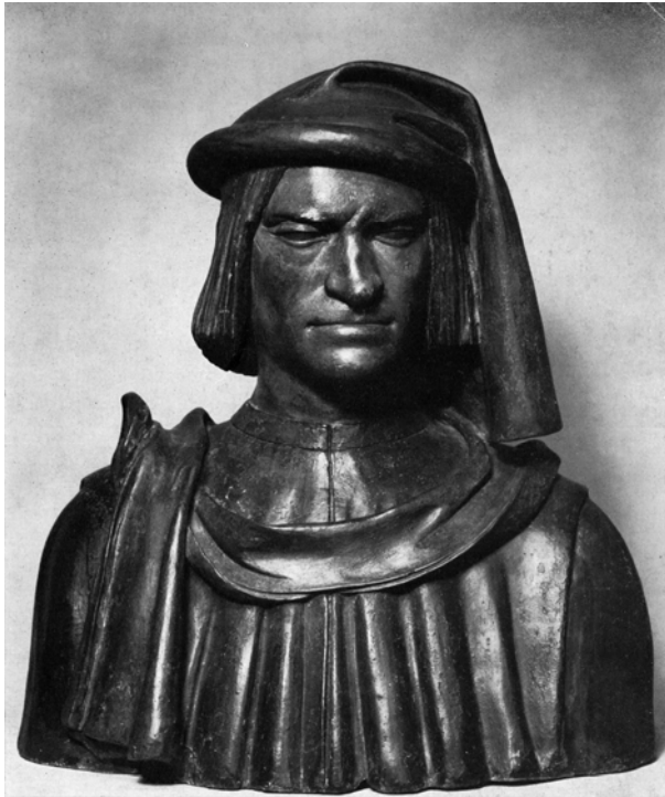
Lorenzo il Magnifico (der Prächtige), 1449 - 1492 (Büste von Andrea del Verrocchio)