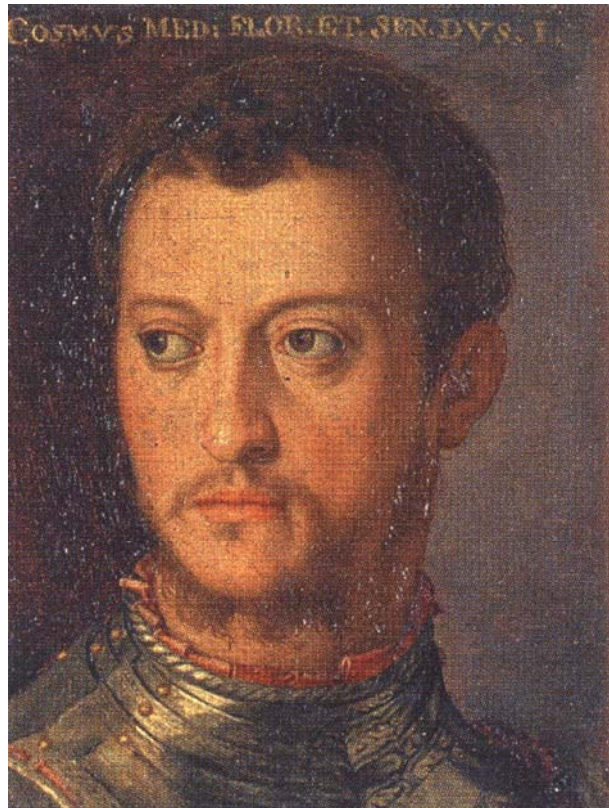
Cosimo I., Großherzog von Toscana, 1519 – 1574 (Werkstatt von Bronzino)

Er kommt sehr jung, 1537, an die Macht und räumt durch Folter, Mord oder Exil zunächst gründlich mögliche Konkurrenten aus dem Weg. Alle Ämter werden mit abhängigen Subalternen besetzt.