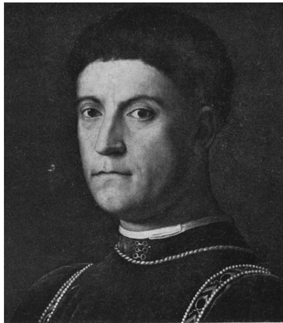
Piero il Gottoso (der Gichtige), 1416 - 1469 (Bronzino)

Für ihren erstgeborenen Sohn Lorenzo bricht Lucrezia mit der Tradition, die Braut in der Florentiner Oberschicht zu wählen. Im Einverständnis mit Piero reist sie 1467 nach Rom und wird mit Clarice Orsini fündig. Damit ist die römische Achse als langfristig ausschlaggebende Erfolgsstrategie vorgegeben.