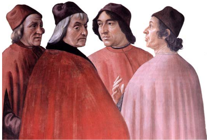
Mitglieder der Platonischen Akademie: Marsilio Ficino Cristoforo Landino Angelo Poliziano Gentile de' Becchi

Lorenzo wird als 5jähriger einem jungen Kleriker aus Urbino, Gentile Becchi, als Erzieher anvertraut. Becchi steht den Dogmen der Kirche skeptisch gegenüber, ist humanistisch gebildet. Lorenzo lernt bald Latein (kein Griechisch), studiert die „lettere“. Darunter versteht die Renaissance das aus der antiken Welt überkommene Wissen. Er liest die großen Dichter der florentinischen Tradition: Dante, Petrarca, Boccaccio. 1473 wird Becchi auf Betreiben seines Zöglings Bischof von Arezzo. Die Bemühungen Lorenzos, ihm zum Kardinal zu erheben, bleiben allerdings erfolglos.