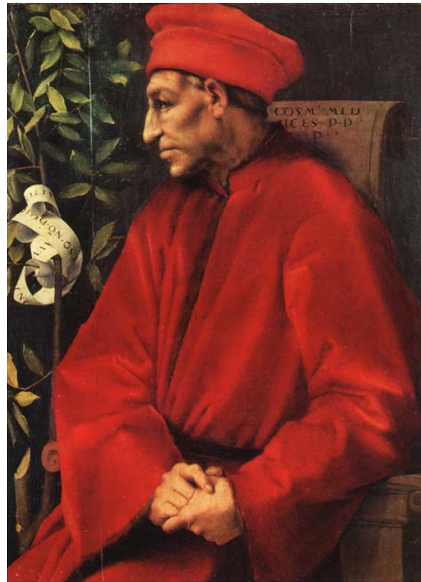
Cosimo il Vecchio (der Alte), 1389 - 1464 (Jacopo da Pontormo)

Cosimos Konkurrent um die politische Macht ist der Adelige Rinaldo degli Albizzi. Als dieser den kostspieligen Krieg gegen Lucca (1429 – 1433), verliert, sinkt er in der Gunst der Florentiner.