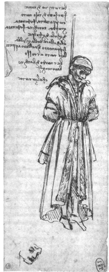
Bernardo Bandini Baroncelli, Mitverschwörer gegen die Medici (Leonardo da Vinci)

1479 fordert Sixtus, gestärkt von Kaiser Friedrich III., Lorenzos Bußgang nach Rom. Lorenzo sagt ironisch, er müsse für den Tod seines Bruders beim Initiator der Verschwörung Abbitte leisten.