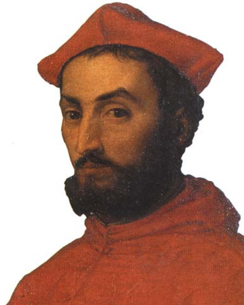
Kardinal Ippolito de' Medici, 1509 – 1535 (Werkstatt von Bronzino)

Im Oktober 1529 beginnt die Belagerung von Florenz durch die Truppen Karls V., unterstützt vom Medici-Papst Clemens VII. Nach heldenhaftem Widerstand ergibt sich die halb verhungerte Stadt im August 1530.