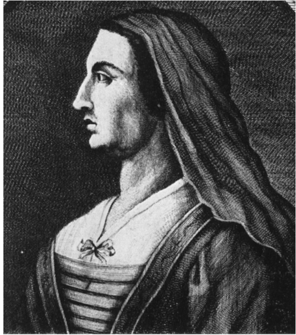
Alfonsina Orsini, Gemahlin von Piero il Sfortunato

Seine Tochter Caterina (1519 – 1589) wird Heinrich II., König von Frankreich, heiraten.